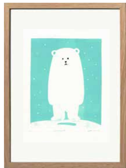
CADRES I3 À I5 étapes d'impression dimensions cadres : 3 30*40cm