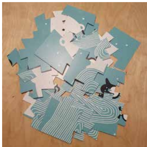
PUZZLE A3 Parcours ludique cartes en PVC (20 pièces)